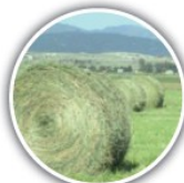
Foin à partir de la 2 e coupe