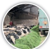
Affouragement en vert